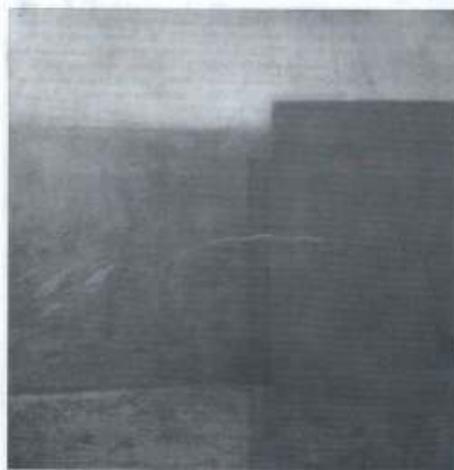
Obra de FRANK JENSEN any 2001

Aquesta exposició es pot visitar a Canals Galeria d'art del 29 d'octubre fins el 29 de novembre