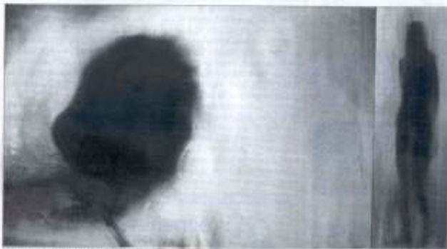
Obra de JOSEP MORENO any 2001

Durant tot el mes de novembre es poden veure dues interessants exposicions d'artistes joves en aquesta galeria, situada al costat de la muralla romana del Real Monestir de Sant Cugat. D'una banda, a la Sala 1 es pot veure l'obra de Frank Jensen i a la Sala 2 les pintures de Josep Moreno.