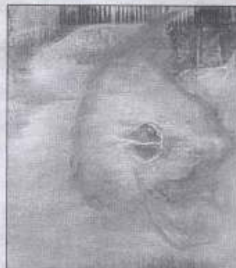
Obra de Josep Moreno

riquesa plàstica a cavall entre l'abstracció i la figuració, amb els elements de la Natura com a punt de partida d'un món de sensacions i de recerca a través de transparències i textures ■