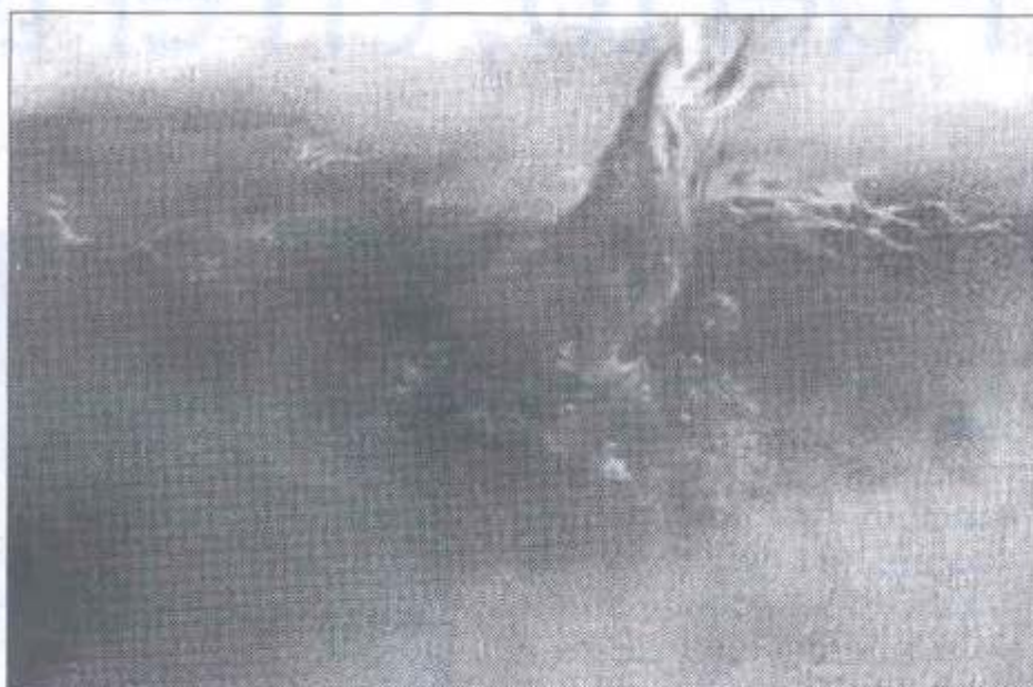
Obra del pintor natural de Orce. • LA OPINIÓN