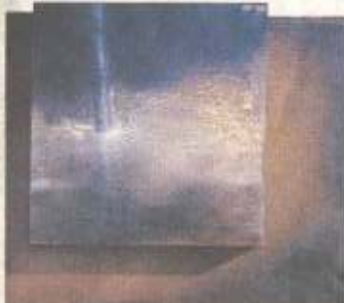
'Agua bañada de sombra' (2003).