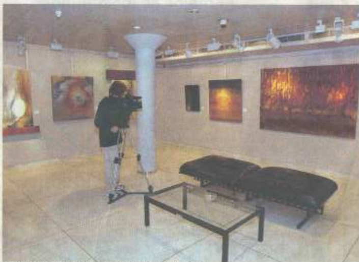
Inauguración de la retrospectiva de Moreno, ayer por la tarde.

ÁNGELES PEÑALVER / GRANADA