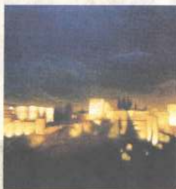
'Tefida de luz', acrílico sobre tela (2004).